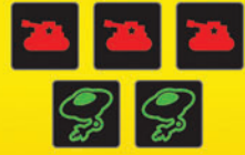
TÖBB TANK, MINT HALÁLSUGÁR? NEM KAPSZ PONTOT.

Először hasonlítsátok össze a féltre tett tankok számát a féltre tett halálsugarak számával. Ha több tank van, mint halálsugár, foglyok nélkül kell elmenekülnöd; arra a körre nulla pontot kapsz, függetlenül attól, hány kockát tettél félre. Ha legalább annyi halálsugarat tettél félre, ahány tankot, sikeresen elhárítod a földlakók támadását és a következők szerint kapsz pontokat a foglyaidért: